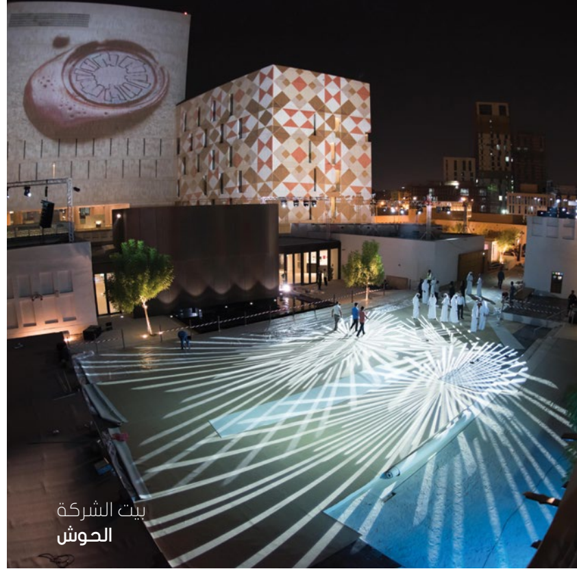
بيت الشركة الحوش

الدعم الفني والتقني، وجميع المرافق الأساسية متوفرة.