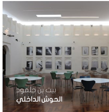
بيت بن جلمود الحوش الداخلي