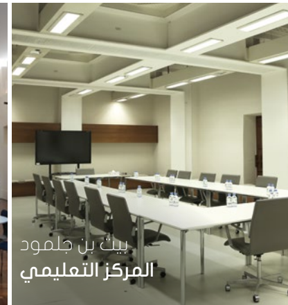
بيت بن جلمود المركز التعليمي