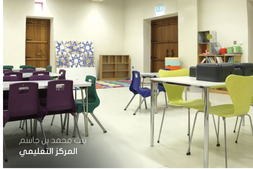
بيت محمد بن جاسم المركز التعليمي