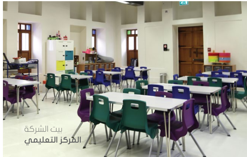
بيت الشركة المركز التعليمي