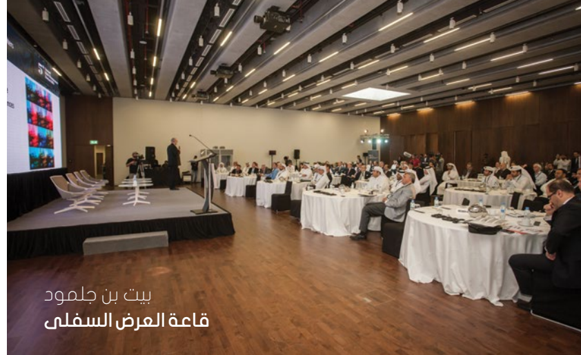
بيت بن جلمود قاعة العرض السفلى